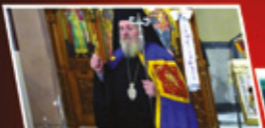
Λειτουργία εορταστικής Ύψιζίας του Τιμίου Σταυρού στην Μητροπολιτική