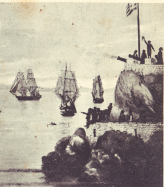
ὅλος ἐξ ἡ πλοίων ὑπὸ τὸν Ναυαρχὸν ΑΝΔΡΕΑΝ ΚΟΣΜΑΝ περιγραφή εἰς τὰ Ἡμερολόγια αὐτῆς Ἀριστοῦ ἐκδοθέντα ὑπὸ Ν. Παύλου. Ἡρώδης Α. Κοσμάς Ἀριστοῦ.