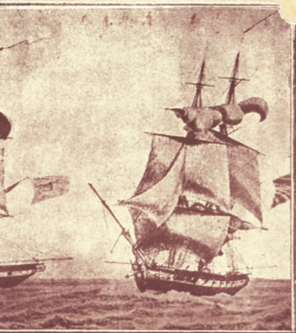
ΠΑΖΗ Ο "ΛΕΩΝΙΔΑΣ,, ΚΑΙ Η "ΤΕΡΨΙΧΟΡΗ,, ή εξέγερσι τοῦ 1821 ἰδίως κατὰ τὸ 1823—1824.