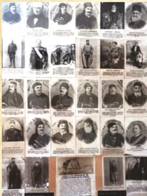
Κρήτες Άγωνιστές.