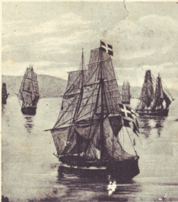
1824 Μαρτίου 22. Αναχώρησις ἐξ Ἰδρακί. Ἰδρακίος στ (Κολμικιάτη ἢ Δροῦτση). Νάυαρχος τὸ πλοῖον αὐτὸ Ἄρης Ἡ Τὸ χειρογράφων ἔστι δ