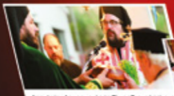
Δομολογικοί Διαμοσχημοί και Τιμίου Σταυρού είναι