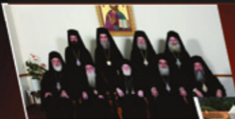
Ανακοινωθέν της Ιεράς Επαρχιακής Συνόδου Εκκλησίας Κρήτης 22/8/20