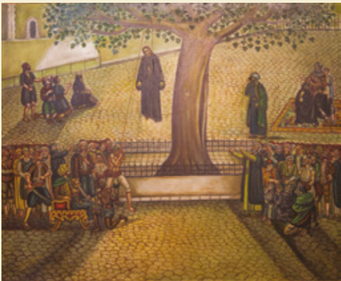
Ὁ ἀπαγχονισμός τοῦ Ἐπισκόπου Μελχισεδέκ. (Πίνακας στόν Ἱερό Ναό Ἁγίου Νικολάου Σπλάντζια)

στήν Βουλγαρική Ὁρθόδοξη Ἐκκλησία καί τό 1818 ἐξελέγη ἐπίσκοπος στήν Ἐπισκοπή Κισάμου καί Σελίνου, μύηθηκε Φιλικός ἀπό τόν Βαρνάβα Πάγκαλο (ὅπως ἀναφέρεται στό βιβλίο «Ὁ Ἱερός κληρός τῆς Ἐκκλησίας τῆς Κρήτης στήν Ἐπανάσταση τοῦ 1821 τοῦ Εὐαγγέλου Παχυγιαννάκη) καί ἀπό τότε ἄρχισε περιοδεῖες σέ ὅλα τά χωριά τῆς Μητροπόλεώς του. Ἐπισκέπτονταν τά σπίτια