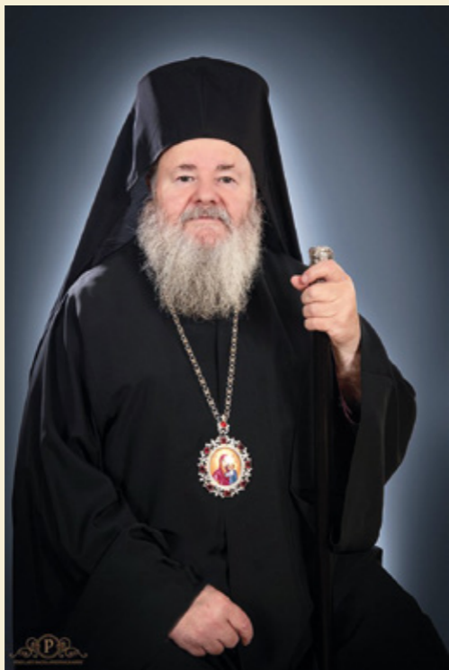
† Ὁ Σεβασμιώτατος Μητροπολίτης Κυδωνίας & Ἀποκορώνου κ. ΔΑΜΑΣΚΗΝΟΣ